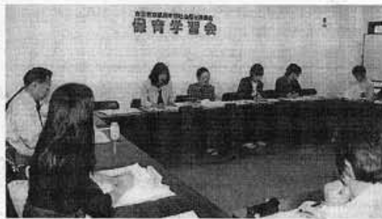
▲活発に意見交換された社福評保育学習会