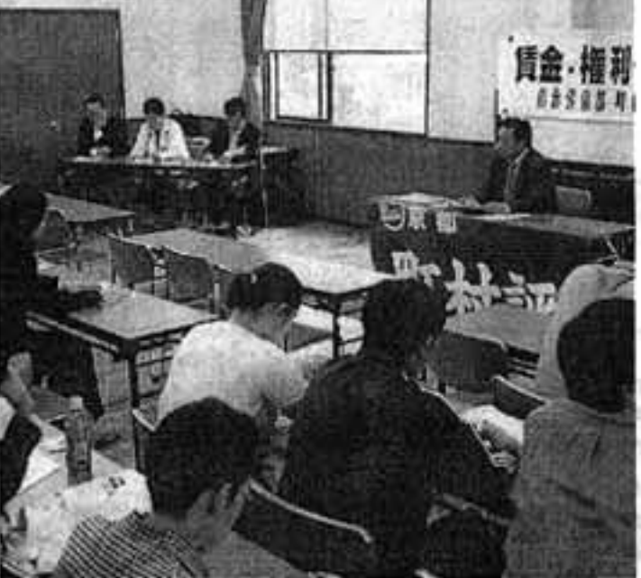
▲29人が参加した町村評賃金権利セミナー

まためた講義を受けた。「五十五年度体制」や「オイルショック」など、ほとんどの参加者は今ひとつ実感が湧かない用語は難解だったかもしれない。しかし、平和な社会の維持があるからこそ労働組合が存在できる、その中で自分たちの労働条件や社会的問題の改善に向けて努力ができる、また逆に労働組合の存在があるからこそ平和な社会の維持ができる、このセミナーを通じて再認識された。