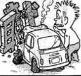
自治労の自動車共済

「失職」注意！ 地方公務員は、交通事故を起すと失職する可能性がある。だから、賠償するだけの保険・共済では決して充分とはいえない。自治労の自動車共済は、失職を防ぐための活動を行っています。このような活動を行うのは自治労の自動車共済だけです。