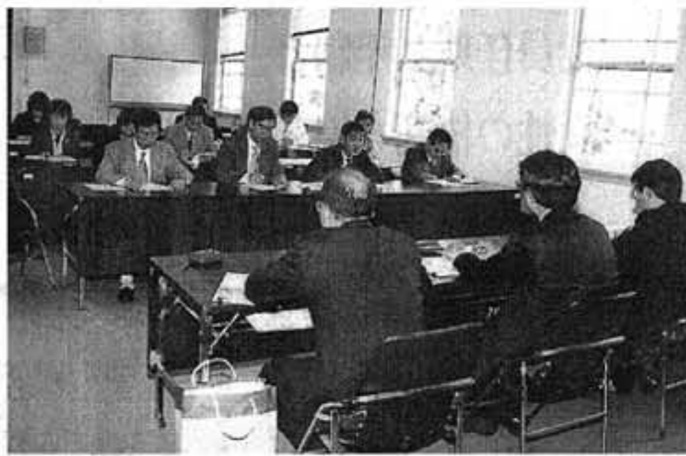
▲府地方課と交渉する府本部執行部と単組代表者

野藤子(府本部)が発足。現在、昨年の定期大会で提起したポジティブアクションプロジェクトの単組意見集約中で、各単組での議論を深めていた。委員会メンバーは次野藤子(府本部)